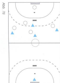
Gleichzahl 4 gegen 4